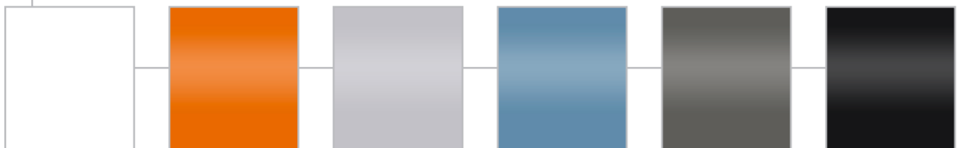
Frost-Weiß (Standard) Hokkaido-Orange (optional) Polar-Silber (optional) Chroma-Blau (optional) Magnetic-Grau (optional) Obsidian-Schwarz (optional)