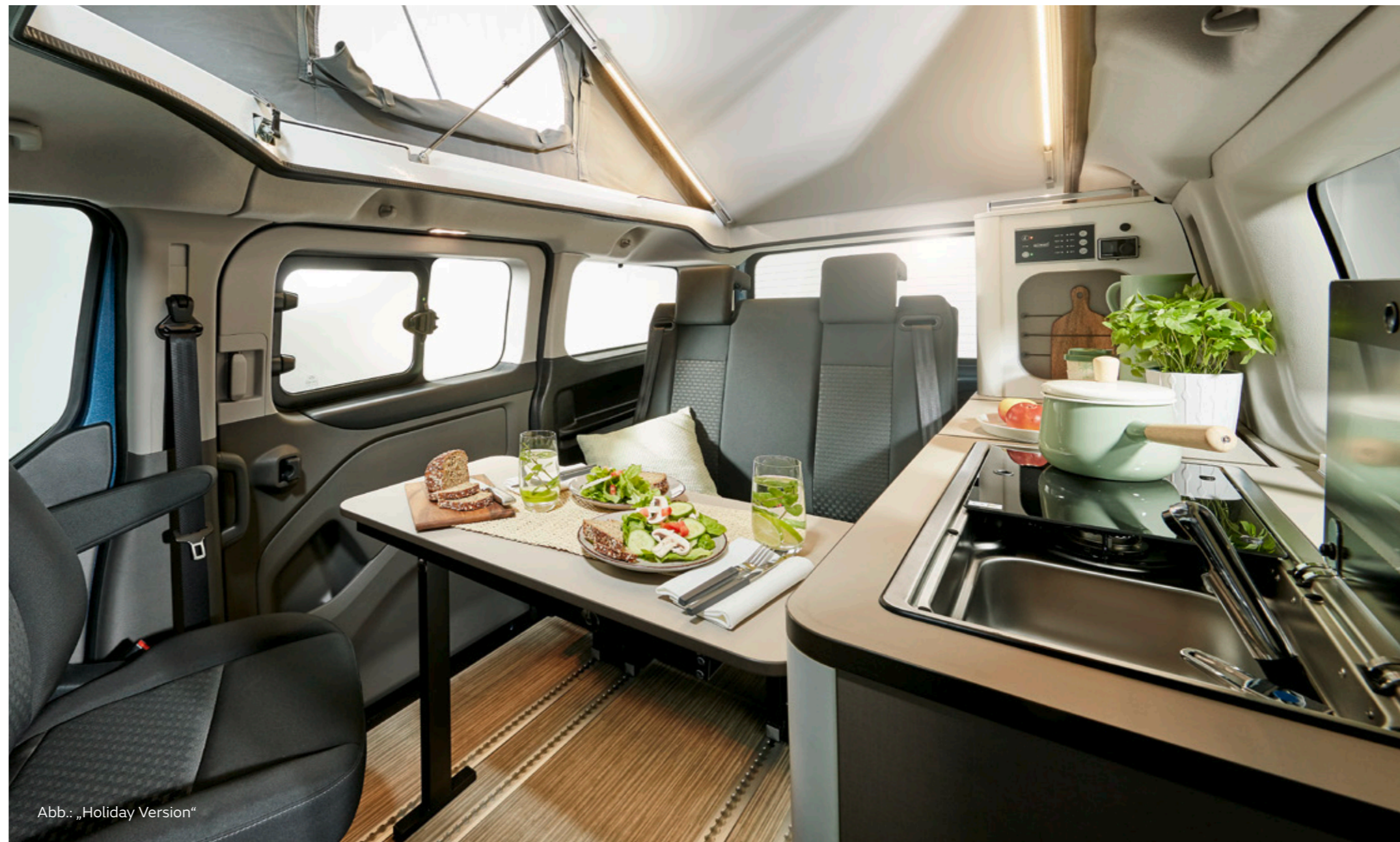
Abb.: „Holiday Version“